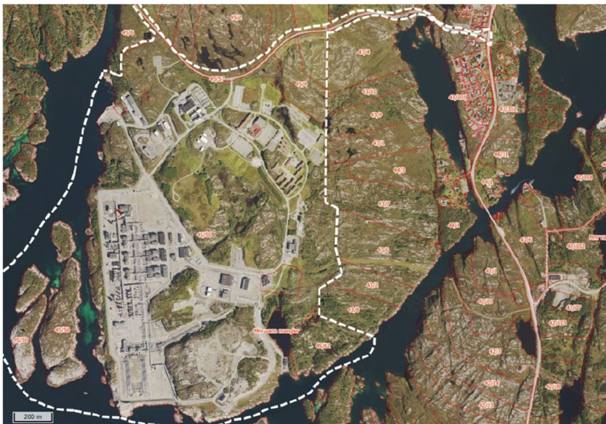
Avgrensning av planområdet ved oppstart. Vedlagt søknad syner godt kva som blir endringar i høve gjeldande plan (19910001).