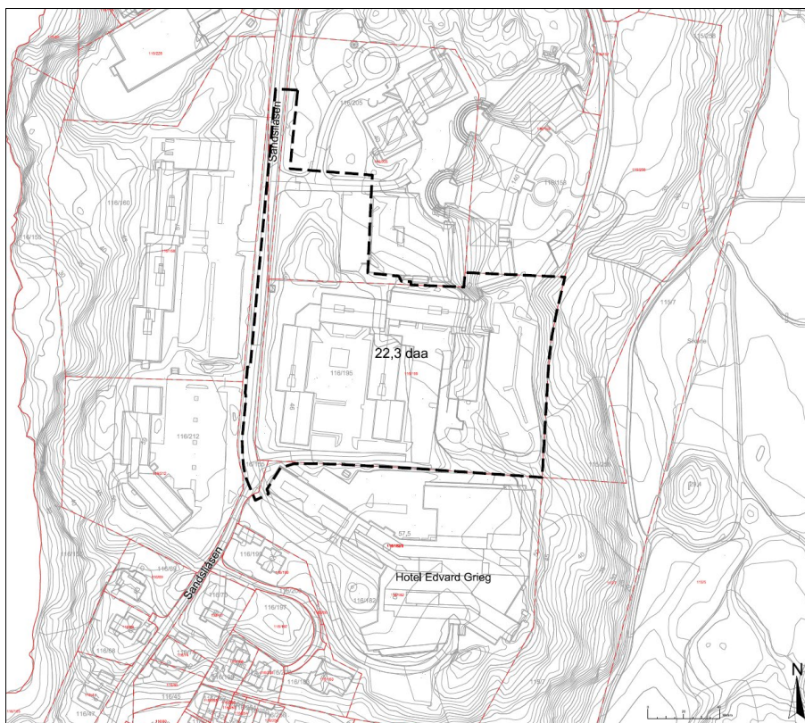
Figur 0-1: Varslet planområde. Plangrensen inkluderer areal til atkomst og avkjørsler med frisikt, grøntområde i nord og del av kjøreareal i Sandliåsen bort til regulert fortau i vest.