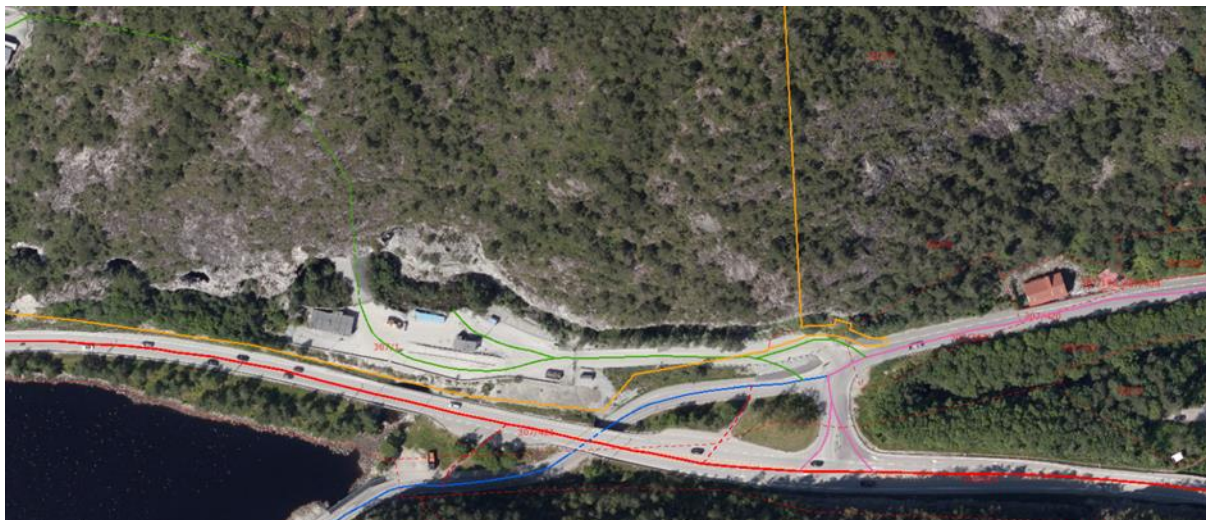
Figur 2: Vegnett til Arna Steinknuseverk

Arna steinknuseverk har adkomst fra FV238 Gaupåsvegen med avkjørsel fra E16. Transporten av stein fra og til knuseverket skjer primært via E16, mens en mindre andel av trafikken går til/fra Kolakaaien som har adkomst via Gaupåsvegen.