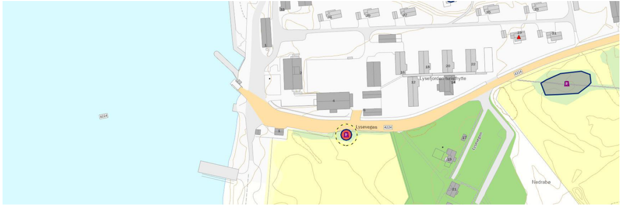
Figur 3 Gravhaug vist med rød sirkel.

Hele Lysebotnen og fjorden er registrert som vernet kulturmiljø. I og med at området er registrert som et Kula-område skal det forvaltes ihht. til dette. Det vises bl.a. til Kulturhistoriske landskap av nasjonal interesse i Rogaland