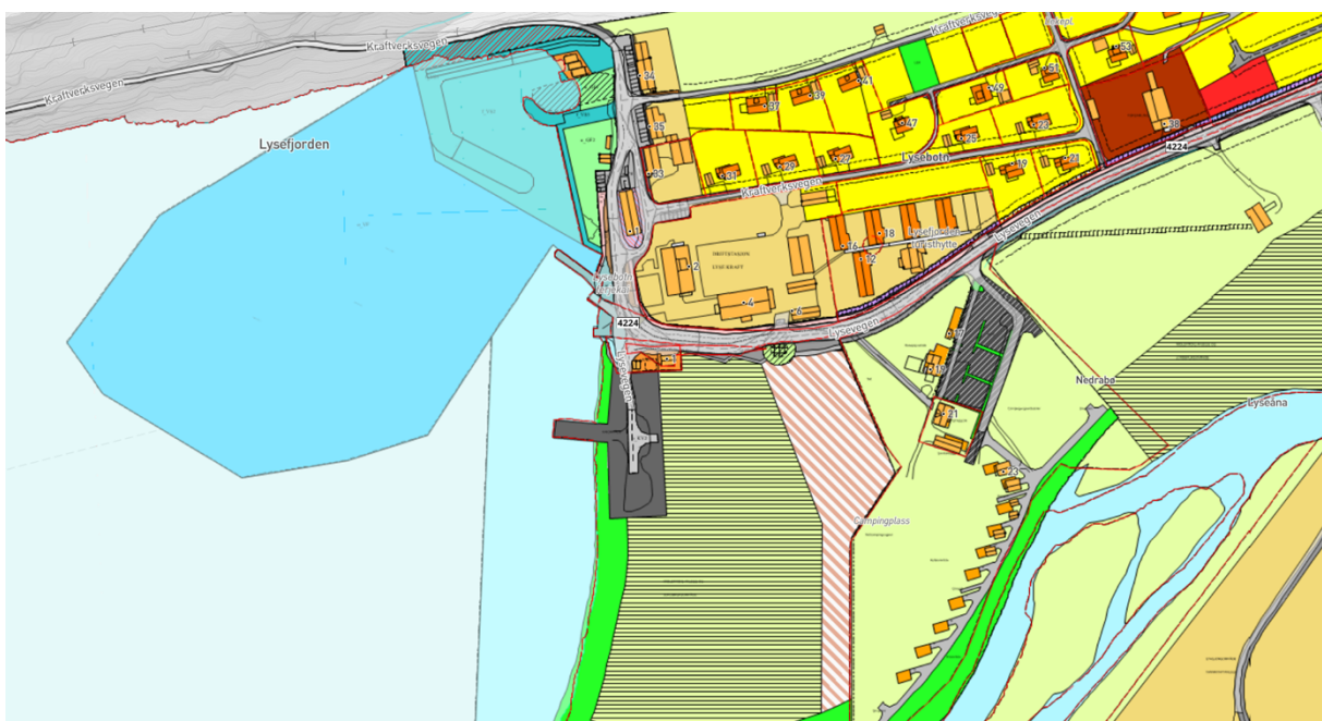
Figur 2 Utsnitt av gjeldende regulering