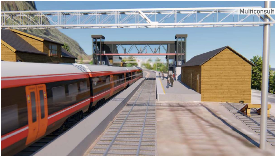
Figur 2: Illustrasjon av planfri kryssing som overgang. Kjelde: Plattformforlenging Vossebanen, optimaliseringsrapport Bane NOR.