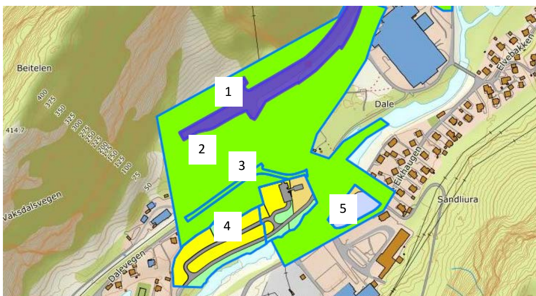
Figur 3: Kartet viser omriss av planar innanfor eller som grenser til planområdet.