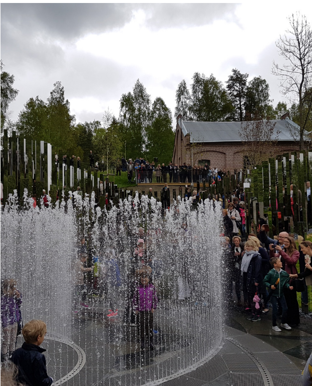
I sentrum av installasjonen er det en interaktiv fontene med vannstråler i ulike intervall