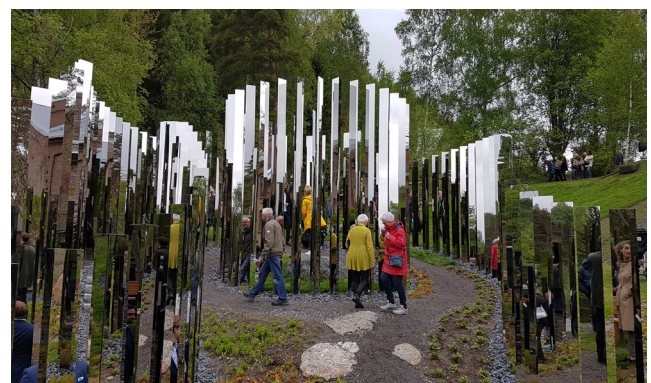
Øverst: Granittrinn tar opp høydeforskjeller inne i skulpturen | Foto: Multiconsult Nederst: 460 speilsøyler i labyrintformasjon skaper ulike rom | Foto: Multiconsult