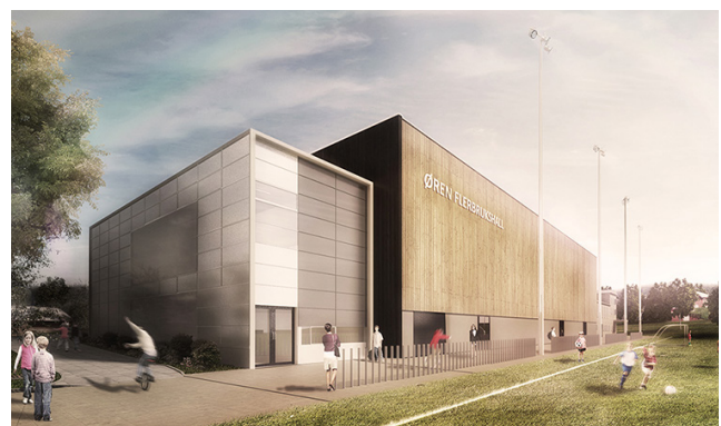
Øverst: Skolegård – detalj illustrasjonsplan | Illustrasjon: Multiconsult Nederst: Øren flerbrukshall | Illustrasjon: Architectopia Arkitekter