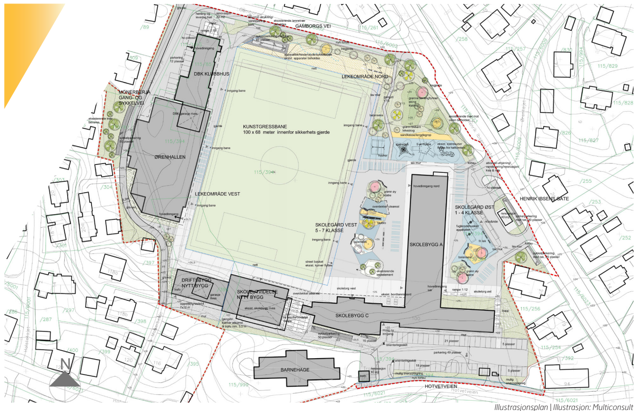
Illustrasjonsplan | Illustrasjon: Multiconsult

Prosjektet Øren barneskole og flerbrukshall omfatter utomhusplan for skolegård, utearealer rundt ny flerbrukshall og innpassing av ny kunstgressbane mellom hall og skolegård. Behovet for en større omstrukturering av utearealer ble gjort i forbindelse med utvidelse av skolebygget med nye 1500 m 2 , utvidelse av eksisterende kunstgressbane og bygging av ny flerbrukshall på 2400 m 2 . Oppdraget ble gjort sammen med Architectopia arkitekter som hadde skisseprosjekt på utvidelse av skolebygget og detaljprosjektering av ny flerbrukshall. Oppdraget ble tildelt av Drammen Eiendom KF. Øren skole fra 1960-tallet opplever sterk elevvekst og ønsket økt fleksibilitet og omstrukturering av arealer for å møte nye behov. I tillegg til at det var behov for generell utvidelse og oppgradering av skolens bygg og uteoppholdsarealer.