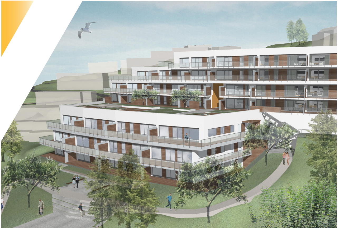
Visualisering av bygg og utomhusanlegg | 3D-modell: LINK arkitektur

Bygget er terrassebygg og ligger på en bratt tomt med flott havutsikt. På grunn av tomtens beliggenhet er en stor del av uteoppholdsarealene på en felles takterrasse. På takterrassen er lekeplass, plantefelt, tredekke og belegningsstein. Utomhusanlegget for øvrig består av, grøntanlegg, amfi i granitt, store natursteins- og betongmurer, stier, og naturområde.