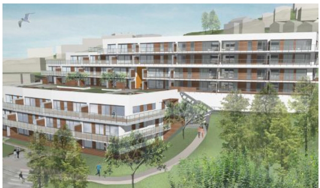
Øverst: Visualisering av bygg og utomhusanlegg | 3D-modell: LINK arkitektur Nederst: Visualisering av bygg og utomhusanlegg | 3D-modell: LINK arkitektur