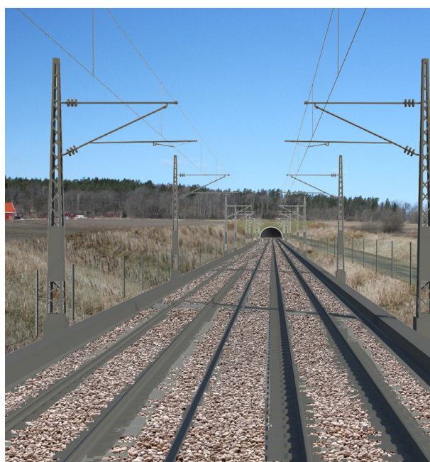
Tunnelportal ved Carlberg | Ill.: Multiconsult