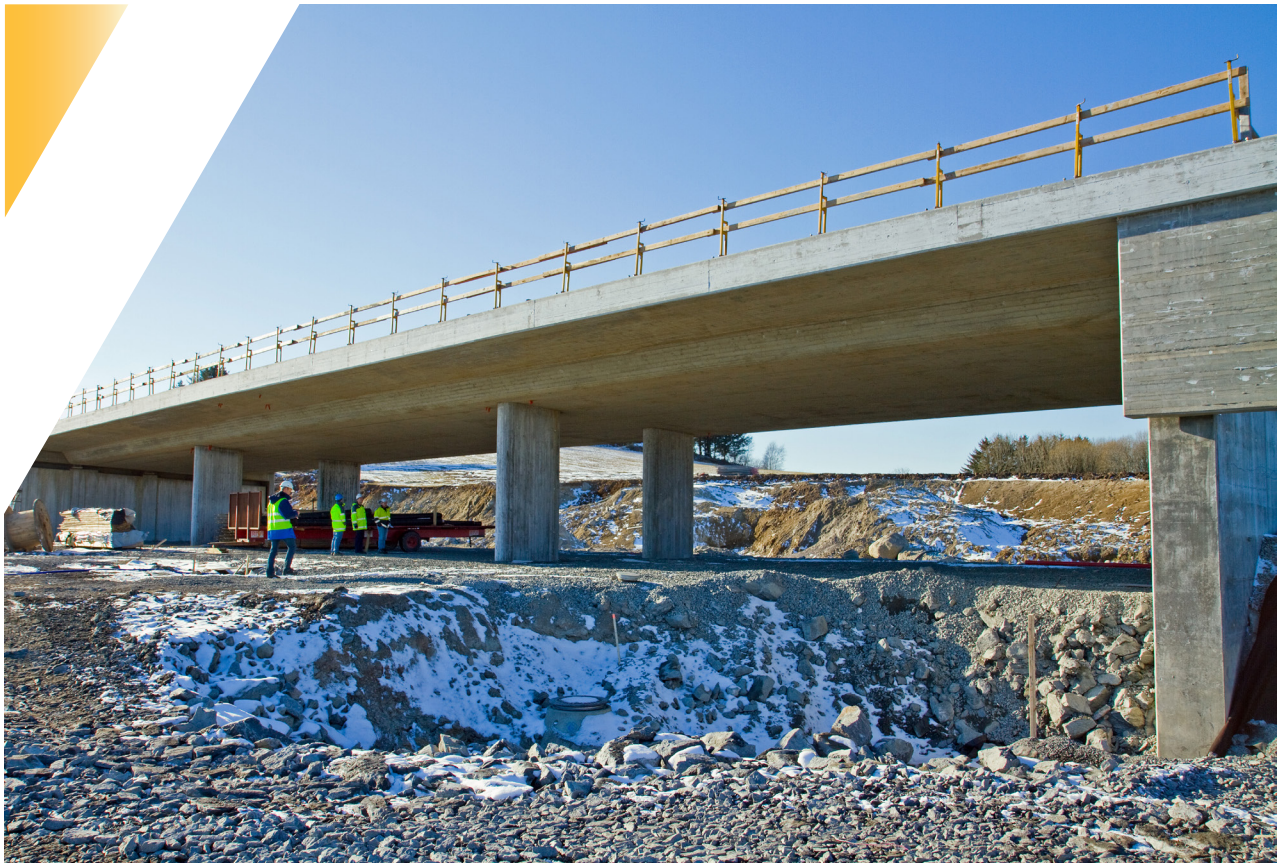
Kidlingsberget bru

Rv. 510 Solasplitten omfatter ny vegforbindelse ca 4 km mellom Stavanger Lufthavn (Sømmevågen) og E39 nord på Forus, inklusiv kryssende konstruksjoner samt konstruksjoner i linjen. Konstruksjoner som krysser vegen blir tilrettelagt for fremtidig utvidelse til 2 felt i hver retning.