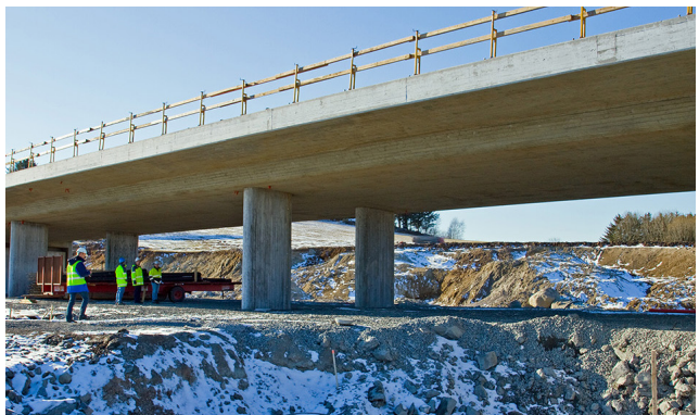
Kidlingsberget bru