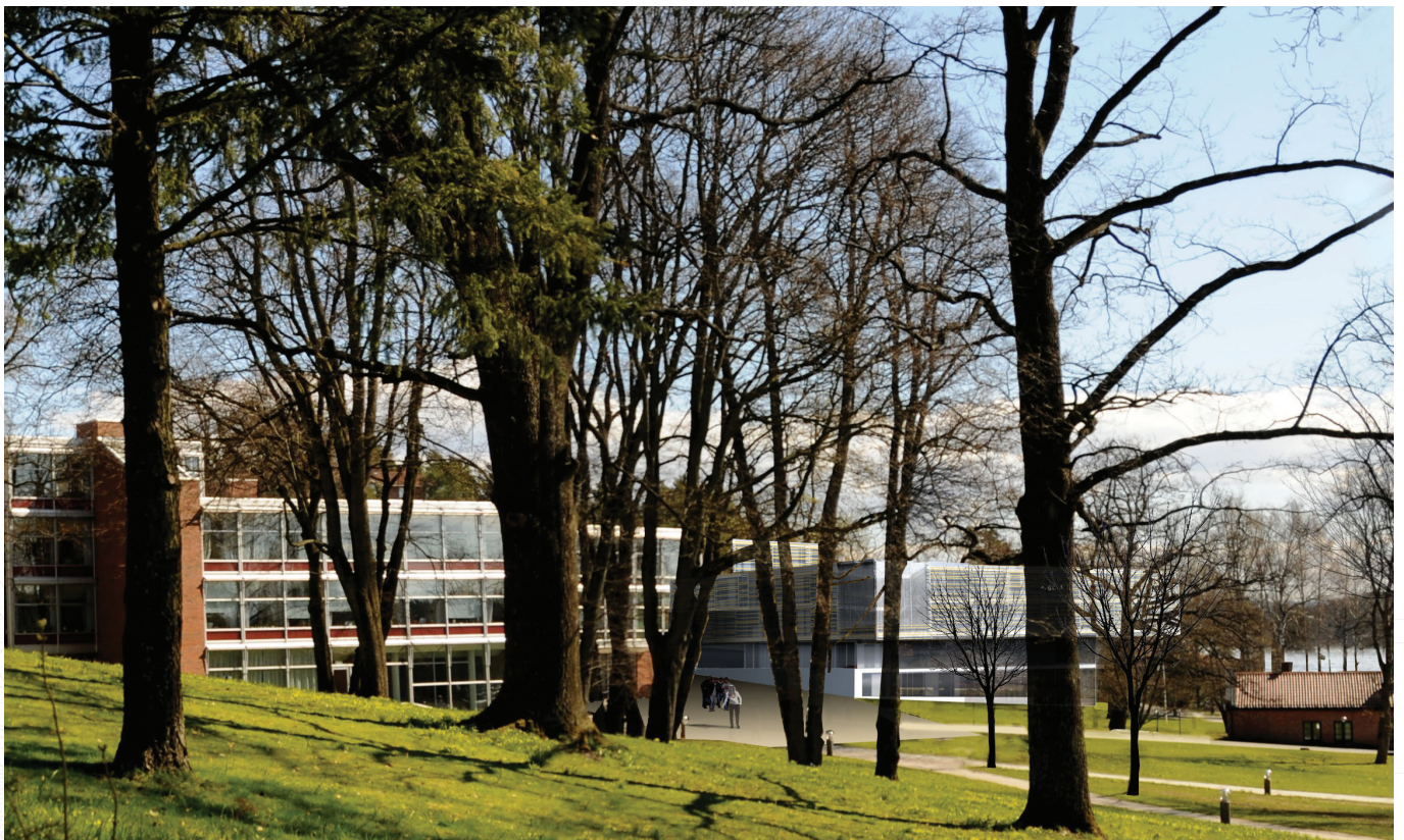
Veritas - byggetrinn 3 | Fotomontasje: Multiconsult

Veritas 3 er på ca 30.000 m 2 kontorarealer pluss en parkeringskjeller med plass til ca. 800 biler. Det nye kontorbygget skal BREEAM-NOR sertifiseres og har ambisjonsnivå Excellent.