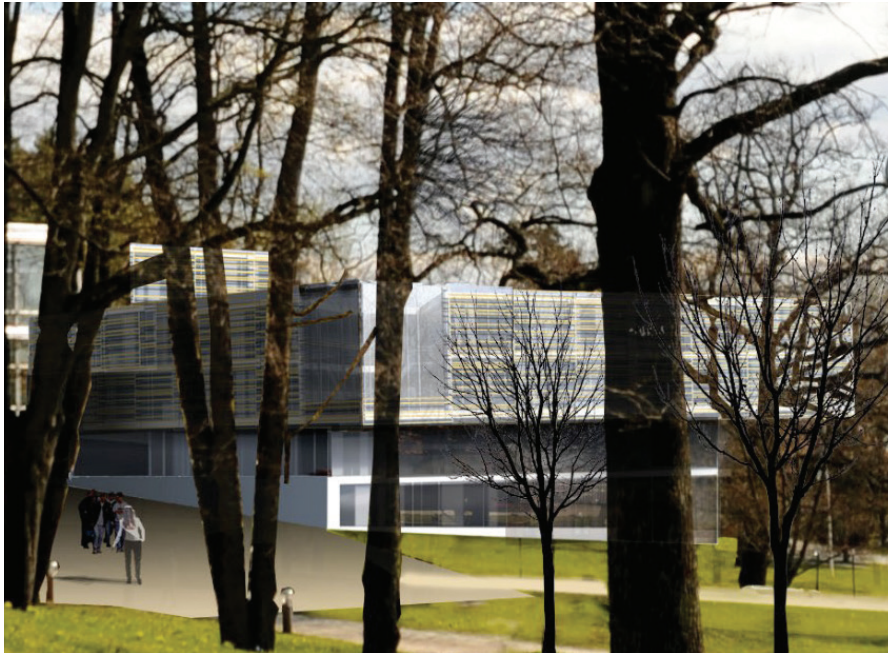
Veritas - byggetrinn 3 | Fotomontasje: Multiconsult