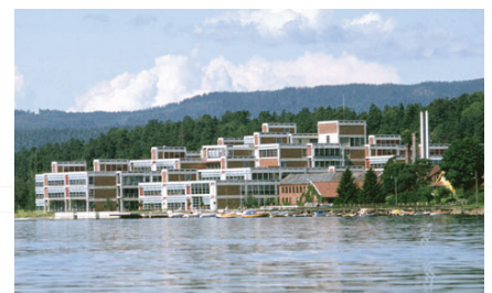
Veritas sett fra sjøsiden | Foto: Lund+Slaatto Arkitekter AS